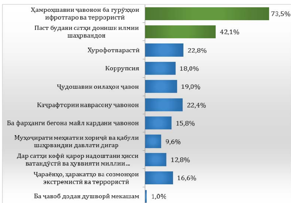
Диаграммаи 1. Ба сулҳу салоҳ, амният, ваҳдат ва истиқлолияти давлати мо кадом хатарҳо бештар таҳдид менамоянд? (n=600, %)

Сарчашма: Шоисматуллоев, Ш. Ватандӯстӣ, маърифати ҳуқуқӣ, ҳувияти миллии ва муқовимат ба муқобили экстремизм дар шароити ҷомеаи муосири Тоҷикистон [Матн] / Ш. Шоисматуллоев, Ф.С. Миrows. – Душанбе: Дониш, 2024. – 127 с.