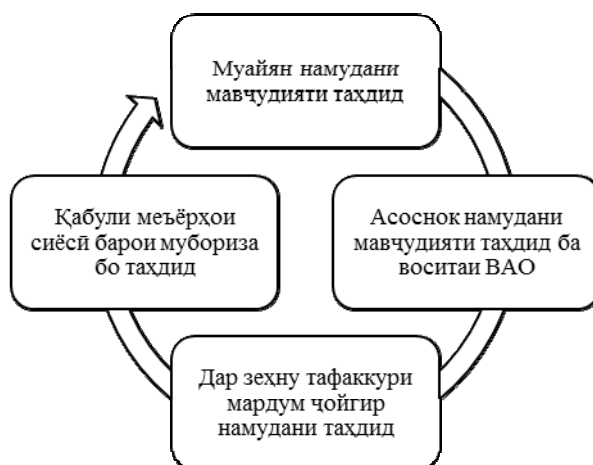
Расми 2. Раванди секюритизатсия

Дар маҷмуъ, секюритизатсияро ҳамчун занҷираи даврашакл тасаввур кардан мумкин аст, ки аз марҳилаҳои зерин иборат мебошад: ҳукумат, ё дигар субъектҳои, ки аз мақеи ҳукумат пуштибонӣ мекунанд, дар бораи таҳдидҳои мавҷуда суҳбат менамоянд, сипас ВАО аз мавҷудияти таҳдидҳои воқеӣ мардумро огоҳ месозанд, оммаи мардум таҳдидро қабул ва ё инкор мекунанд ва дар охир ҳукумат барои мубориза бо таҳдид чораҳои сиёсӣ меандешад. Барои он, ки қарори қабулгардида аз ҷониби омма эътироф гардад, ҷомеа бояд идеологияи маркази қабули қарорҳои сиёсиро дарк намояд. Аз ин рӯ, нақши ВАО ва ниҳодҳои иҷтимоикунонӣ дар ин раванд хеле назаррас аст.